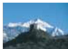
Il castello, ora restaurato e sede di manifestazioni, si staglia sulla neve delle Dame di Challant