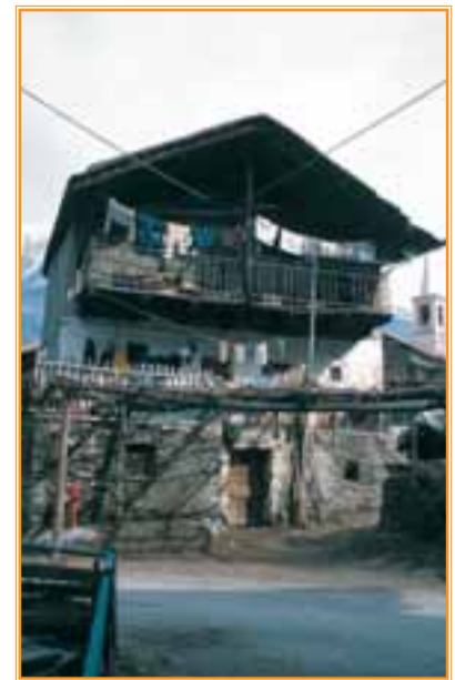
Il villaggio di Ussel-Crétaz è intensamente abitato e ricco di case tradizionali assai ben conservate

Il maniero, costruito nella metà del XIV secolo dai Challant, è a struttura monoblocco con prevalenti funzioni di difesa; pregevoli le murature, le bifore, le torrette sporgenti e la linea di archetti ciechi. Esso ospita periodicamente manifestazioni e mostre. Il roccione su cui sorge costituisce un giacimento di ferro (magnetite) ampiamente sfruttato dal XVII secolo ma ancora ricco di minerale; con pru-