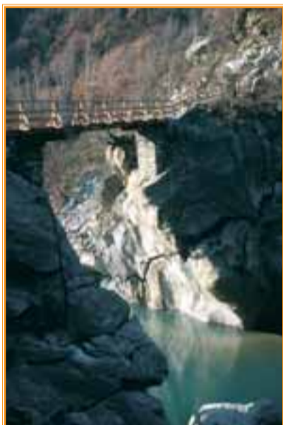
Il vecchio e glorioso Ponte delle Capre resiste a tutte le piene della Dora, mentre i ponti più recenti sono stati spazzati via nell'alluvione dell'ottobre 2000

Entrambe le linee urbane fanno capolinea al Ponte Romano, dove vi è anche un posteggio. È anche possibile proseguire in auto circa 700 m e parcheggiare più avanti sul percorso. In ogni caso dal giardino si costeggia lo stabilimento Fera, poi si prende a destra