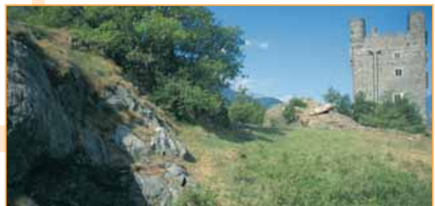
Una galleria dell'antica miniera di ferro si apre nel ripiano erboso a lato del castello. Le rosse rupi di serpentino infatti sono ricche di magnetite

il sentiero comincia a salire deciso, e si passa accanto ad una seconda carbonaia.