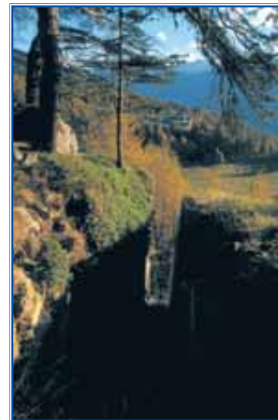
Nel folto del bosco di Fromy ci si imbatte in antichi lavori di cavatura del marmo, misteriose testimonianze di attività dimenticate

passato glorioso, con lastricature e scarpellature in roccia, risalenti ai tempi in cui, non esistendo la strada regionale, questo era il principale passaggio dalle alte valli walser alla valle centrale. Si sale a mezza costa con belle aperture sulla grande valle e, in primo piano, la pittoresca chiesetta di Amay. Anche la campagna circostante fa parte del panorama con alcuni grossi villaggi compatti che dall'alto mostrano i loro armoniosi tetti in lose al margine di prati ben irrigati. In primavera le sponde del sentiero e gli incolti circostanti sono rallegrati da intense fioriture di orchidee selvatiche. Un naturalista attento osserverà poi che la mulattiera salendo segue il contatto fra le antiche colate sottomarine di lava basaltica, ora affioranti come pietre verdi, e i sovrastanti sedimenti oceanici, ora affioranti come teneri calcescisti brunici. I