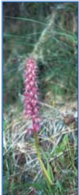
Numerose orchidee selvatiche rallegrano il cammino verso il Col du Joux. Qui un esemplare di Orchis mascula

Appena in vista delle case di Amay, salendo da Saint-Vincent per la strada regionale, si stacca una mulattiera sulla destra, segnalata col n°2. Poco prima a sinistra si apre un ampio slargo per chi deve posteggiare. Il tracciato della mulattiera, ora esile nell'erba, rivela un