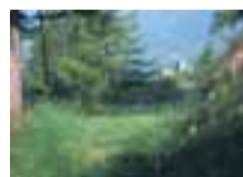
La cappella di Amay, occhieggia in fondo allo storico sentiero che collega con la Val d'Ayas