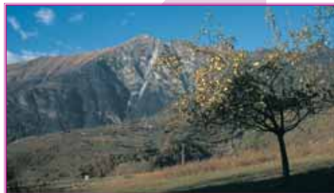
Antiche varietà di frutti tradizionali maturano a 1000 metri intorno al villaggio di Lentj. Orti e frutteti prosperano in questa oasi verdissima sulla costa arida al confine con Emarèse