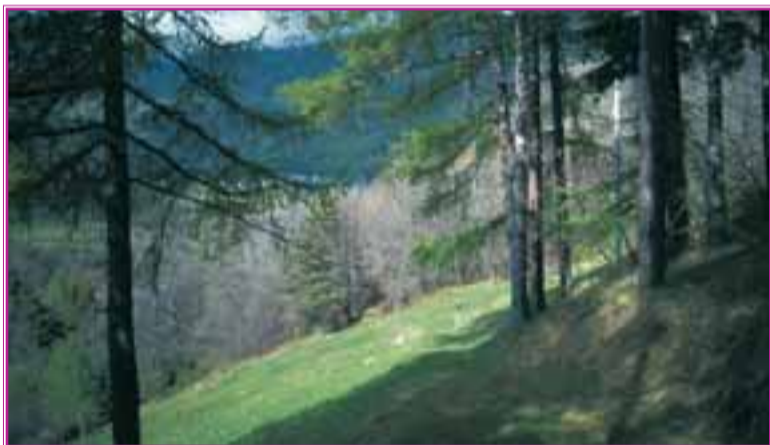
Fra prati fioriti e luminosi boschetti il sentiero sale verso Lentj

Attraversatala, il bel sentiero, dapprima ripido, poi più pianeggiante, comincia a salire fra prati e castagni lasciando sulla sinistra il villaggio di Perellaz. Oltrepassata una costina rocciosa, si entra nel valloncetto del torrente Cillian, dove il bosco diviene umido e scuro;