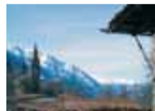
La chiesa di Moron appare fra le case e le vigne all'uscita dal valloncetto di Cillian

tocca un ruscello in ambiente idillico. Si giunge infine a Valyre (2h 25min) e si scende lungo la stradina asfaltata per Cillian (2h 35min). Entrati nel villaggio si svolta a sinistra nella piazzetta della fontana, e da qui sulla larga strada pedonale si ridiscende comodamente al parcheggio del Ponte Romano.