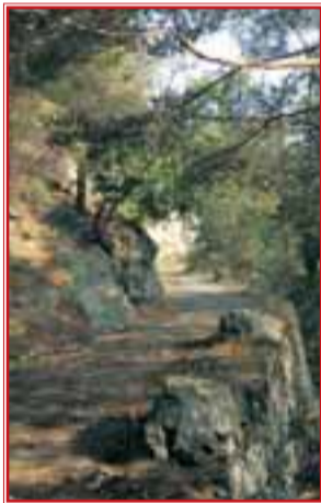
La maestosa strada lastricata, a tratti sospesa su solidi muri a secco e bordata con "pose" squadrate, si lancia a superare un tratto dirupato

noretto di Clapéon, magnifico terrazzo proteso sulla valle al limitar del bosco (20 min dalla partenza).