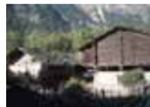
Il grande villaggio di Perrière mostra pregevoli esempi di architettura alpina tra cui alcuni rascards

Realizzazione Cooperativa La Traccia - Aosta Testi Pier Giorgio Crétier Francesco Prinetti con la collaborazione di Ferruccio Curtaz Progetto grafico Federica Gozzi Coordinamento Palmira Orsières