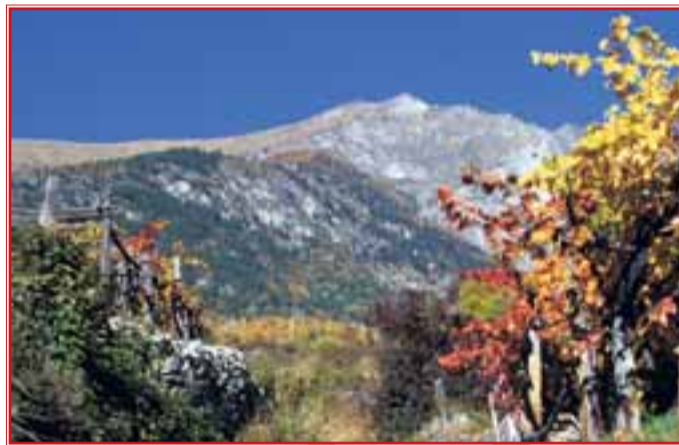
Il Monte Zerbion appare dal sentiero che sale a Clapéon fra le antiche vigne

La piazza di questo villaggio, con bella fontana e chiesetta (inizio sec. XVII), si trova a sinistra, alla fine della strada asphaltata. Da qui ci si può inoltrare sui sentieri che numerosi attraversano i prati circostanti e