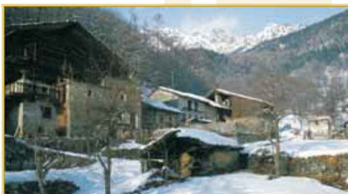
Il villaggio di Valmignana con il forno e le antiche costruzioni alpine occupa una conca nel versante morenico

Pierre Bréan e ancor oggi meta di pellegrinaggi. La posizione del santuario è strettamente analoga a quella della chiesa di San Maurizio a Moron, isolata su di un promontorio roccioso ricoperto di prati; solo l'orientamento è diverso, qui essendo rispettata la direzione verso levante. Nell'interno sono conservate semplici testimo-