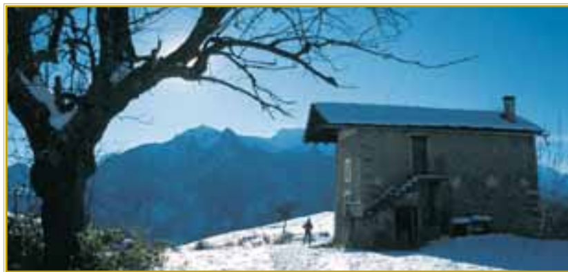
La casa canonica del piccolo Santuario di Grun recentemente restaurata sul dosso erboso che si protende verso la valle

diritto valloncetto col segnavia n°6 . Sempre sul fondo del fresco vallone, a fianco del ruscello, si attraversa il bosco e si esce sui prati di Moron (30 min dalla partenza), a fianco di una fontana ben ristrutturata.