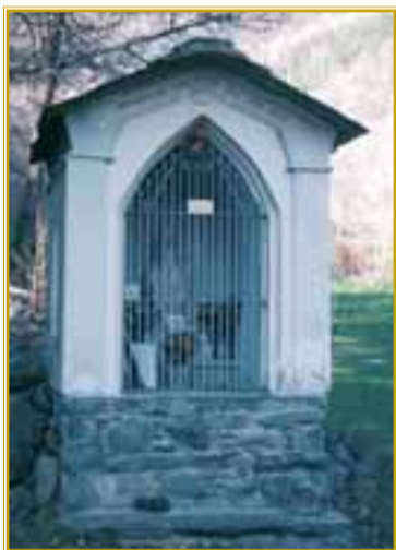
Una cappellina al limitar del bosco, dedicata alla Vergine e a San Grato. Essa segna il bivio: a sinistra Valmignana, a destra Grun

Questa passeggiata segue il percorso della processione che chiude le celebrazioni del mese mariano, l'ultimo sabato del mese di maggio. Da via Ponte Romano si imbecca via Battaglione Aosta che inizia con una elaborata croce di missione del 1947, in pietra e cemento. Si sale fra villette inizio secolo e man mano