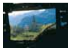
La storica chiesa di Moron occhieggia a primavera dalla porta di un roscard

Realizzazione Cooperativa La Traccia - Aosta Testi Pier Giorgio Crétier Francesco Prinetti con la collaborazione di Ferruccio Curtaz Foto Francesco Prinetti Progetto grafico Federica Gozzi Coordinamento Palmira Orsières