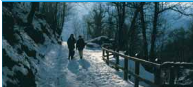
Anche in pieno inverno la passeggiata del canale è apprezzata da residenti e turisti

in una forra verde e fresca di umidità; al fondo scorre una cascatella che si supera su una solida passerella di legno (20 min dalla partenza). L'acqua proviene dal Rû des Gagneurs, che si alimenta dal Marmore a monte del nostro canale, e da Domianaz che visiteremo fra poco. Fra i castagni ora il sentiero tende a sporgersi come un balcone sulla valle.