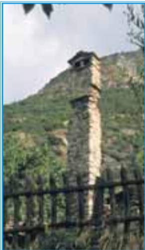
La grande e nobile frazione di Domianaz si annuncia con un rudere dalla canna fumaria intatta

ci troviamo, fin giù al capoluogo ed oltre, si