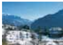
La Tour d'Hérèraz e il contiguo misterioso monticello a tumulo

Con il patrocinio dell'Assessorato Territorio, Ambiente e Opere Pubbliche