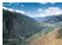
Da Salirod la vista spazia sulla Media Valle e, a sinistra, sull'antica frana che bloccò la Dora.

Realizzazione Cooperativa La Traccia - Aosta Testi Pier Giorgio Crétier Francesco Prinetti con la collaborazione di Ferruccio Curtaz Progetto grafico Federica Gozzi Coordinamento Palmira Orsières